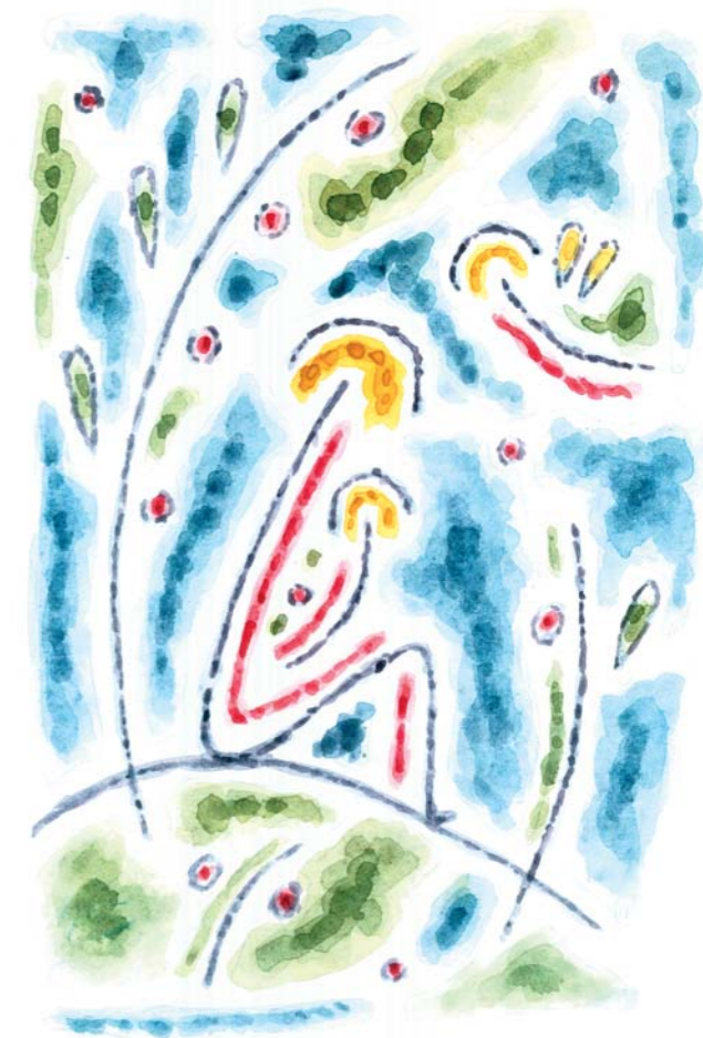
▲ Madonka, akvarel na papieri, 30 x 21cm, 2012