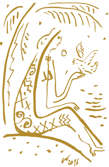
▲ Žena s holubicou, kresba tušom na papieri, 30 x 21 cm, 2016