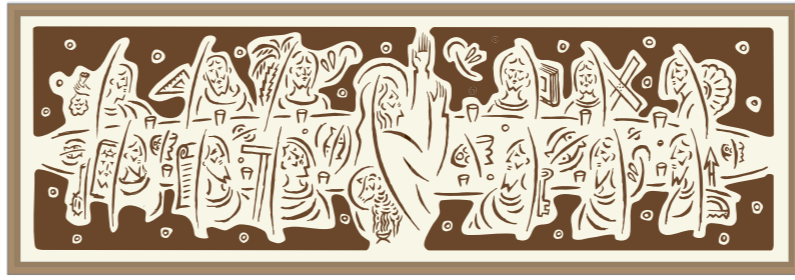
▲ Posledná večera, kombinovaná technika, 2016 (štúdia pre evanj. a. v. Kostol Sv. Trojice v Novej Dubnici)