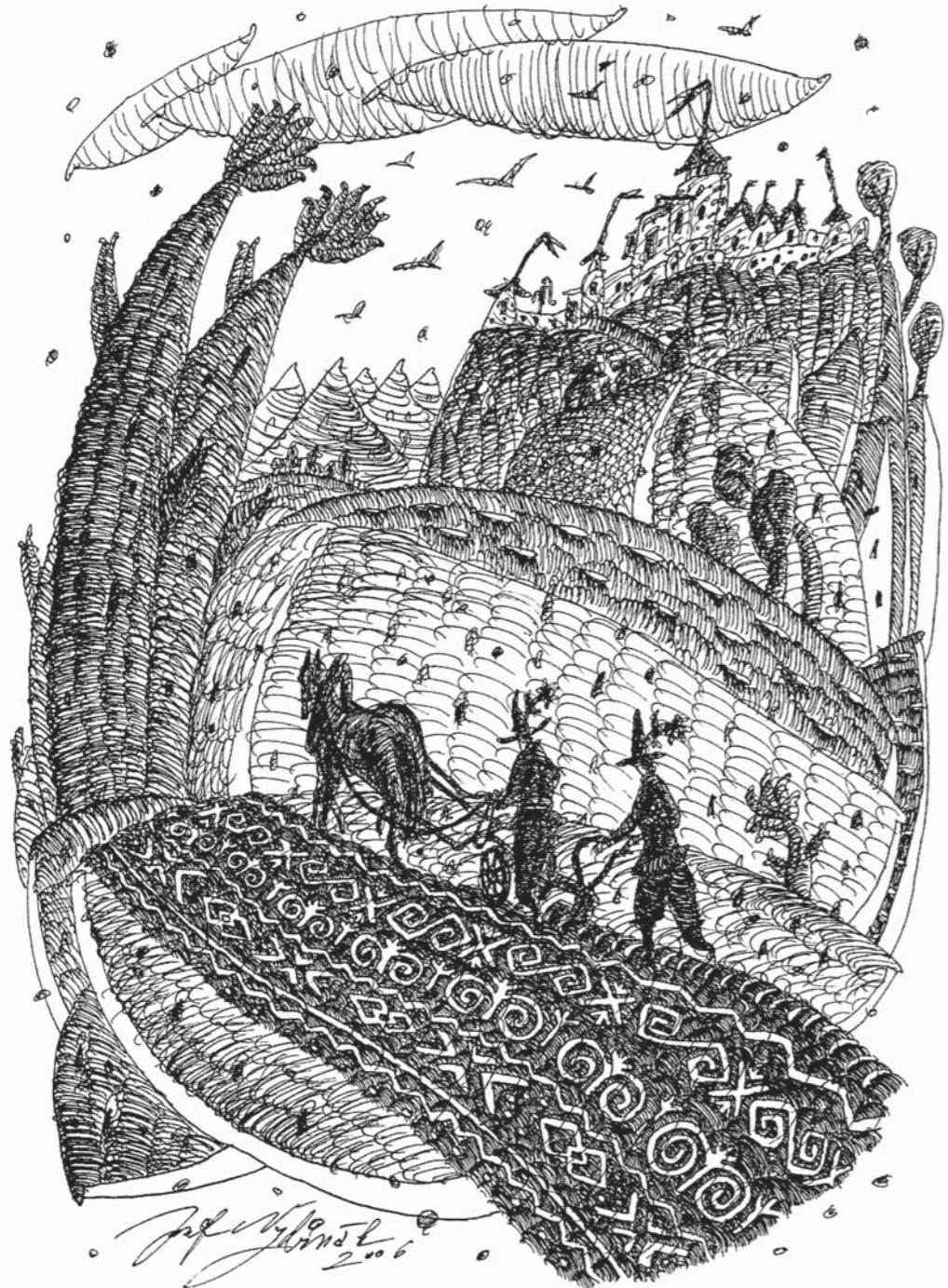
▲ Orba, perokresba tušom na papieri, 42 x 30 cm, 2006