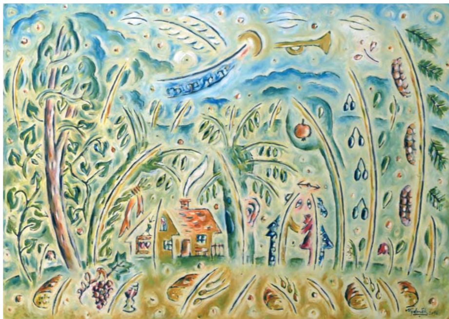
Chlebové pole, kresba tušom na papieri, 21 x 30 cm, 2015