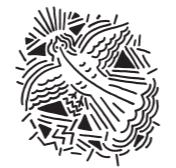
▼ Holubica, kresba tušom na papieri, 21 x 30 cm, 2014