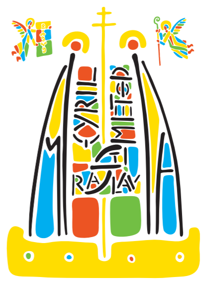
▲ Misia, kombinovaná technika pre digitálnu tlač, 2012