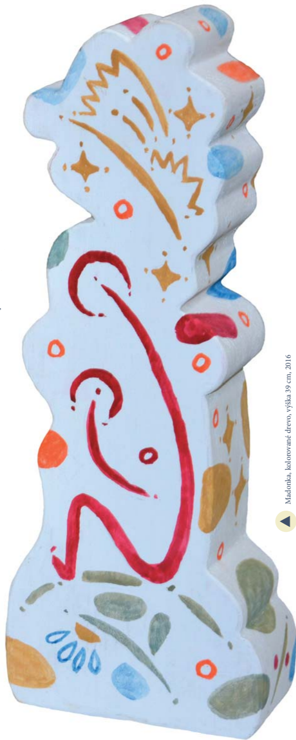
▲ Madonka, kolorované drevo, výška 39 cm, 2016